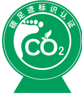
图 1：碳足迹标识认证标志

认证委托人可在通过认证的产品包装、随附文件（如说明书、合格证等）、电子销售平台等位置使用或展示茶叶碳足迹标识认证标志，并可以按照比例放大或者缩小，但不得改变标志中图形的板色、形状和文字。