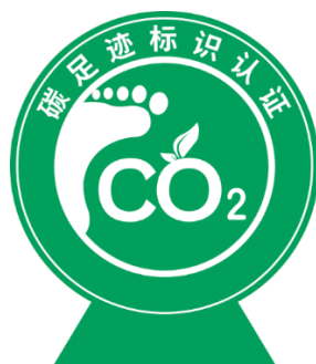
图 1：碳足迹标识认证标志

委托人在获得种植业农产品碳足迹认证证书后，可在证书限定的范围内使用种植业农产品碳足迹标识认证标志（图 1）。